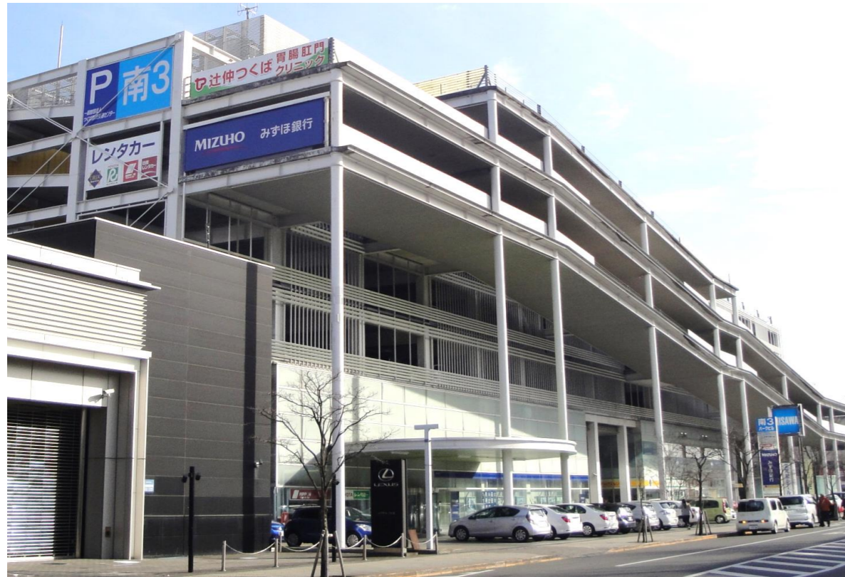
南3パークビル外観