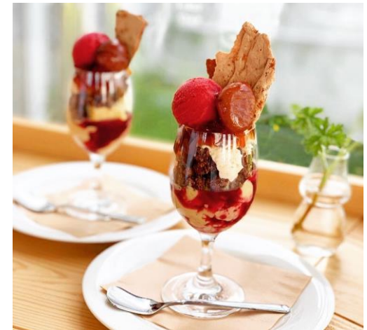
うわさの「WTDパフェ」(期間限定)