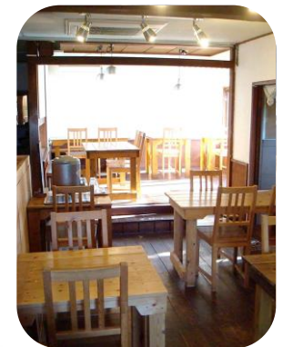
木の温もりが感じられる 店内で、のんびりと。