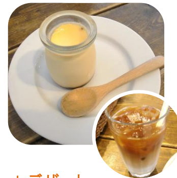
*デザート /ドリンク ランチに各200円~ 追加できます♪