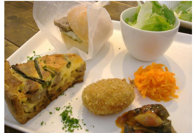
*キッシュプレートランチ 《数量限定です》 具材がごろごろ入ったキッシュでとてもおいしい！