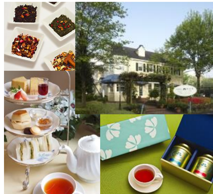
花水木本店へのアクセス